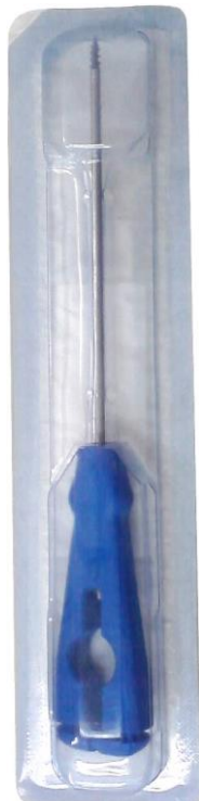
Embalagem Primária Frente