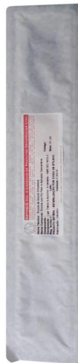
Embalagem Primária Verso

Embalagem Secundária: A embalagem secundária é a embalagem de transporte, onde o implante é acondicionado para transporte envolto em papel bolha para evitar o risco de qualquer impacto. A embalagem secundária contém dados da empresa como Nome, Endereço, CNPJ, telefone e email além dos dizeres "Produto Hospitalar".