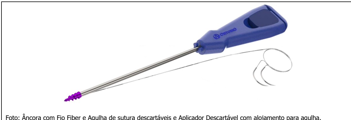
Foto: Âncora com Fio Fiber e Agulha de sutura descartáveis e Aplicador Descartável com alojamento para agulha.

Os modelos com agulha de sutura descartável terão na sua haste um canal lateral para passagem do fio e seu cabo terá uma cavidade para alojamento do restante do fio e das agulhas de sutura descartáveis, protegidas por uma tampa: